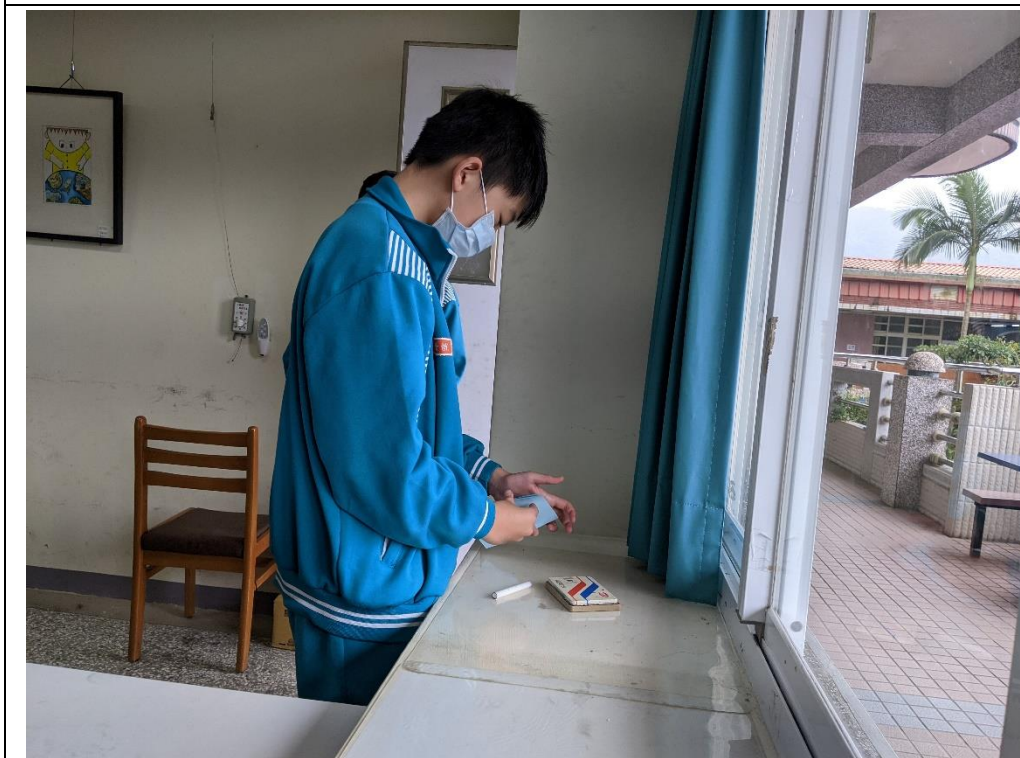
班代表進行投票表決