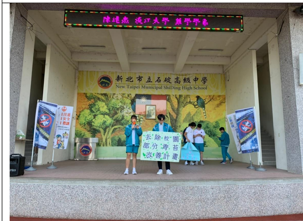
朝會時同學說明方案二