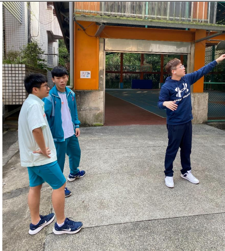
學生與訓育組長討論遮雨設施規劃