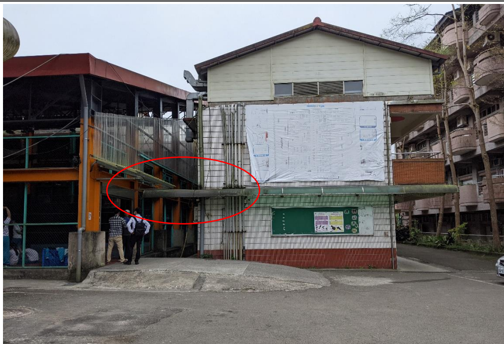
健康中心往風雨操場的遮雨棚