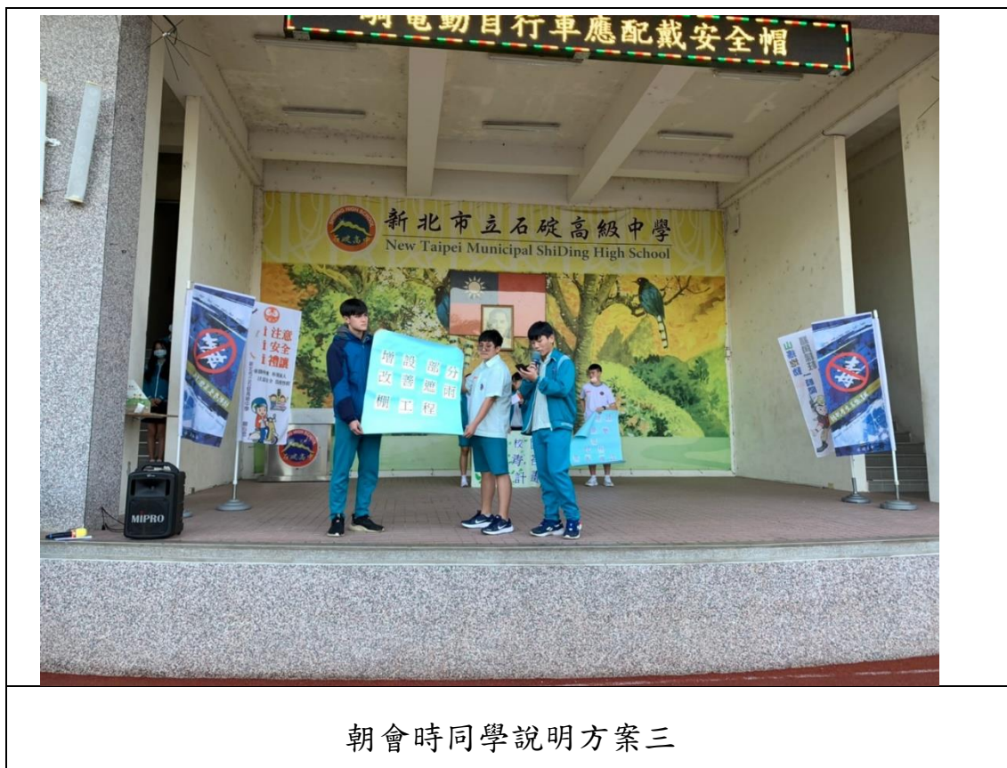
朝會時同學說明方案三