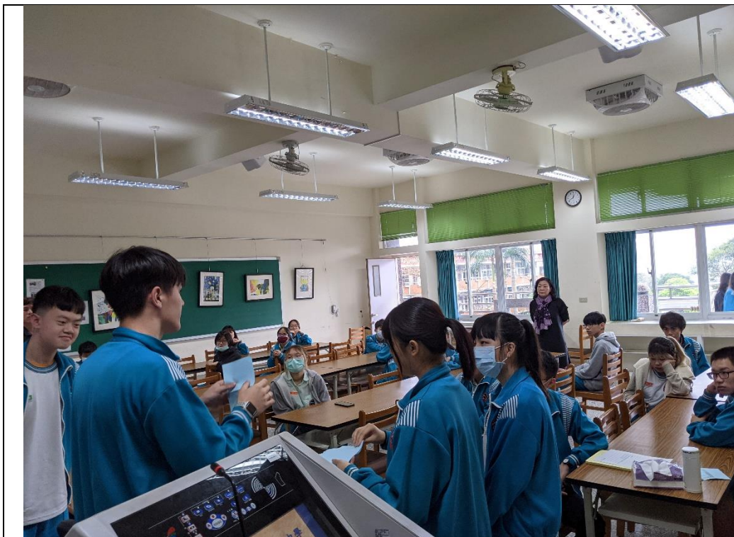
由學生自治會進行唱票計票活動