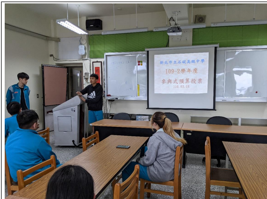
召開班級代表大會票選最佳方案