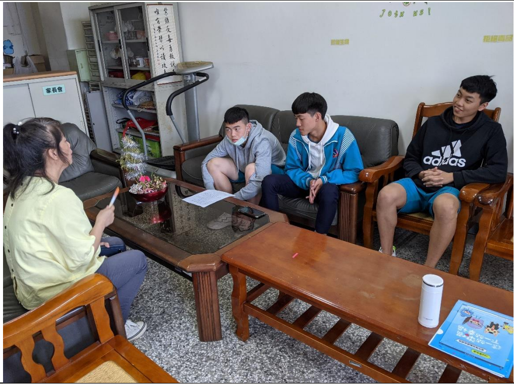
學生與學務主任討論提案內容