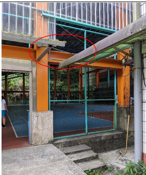
遮雨棚間尚有空隙，下雨時仍會被雨淋到