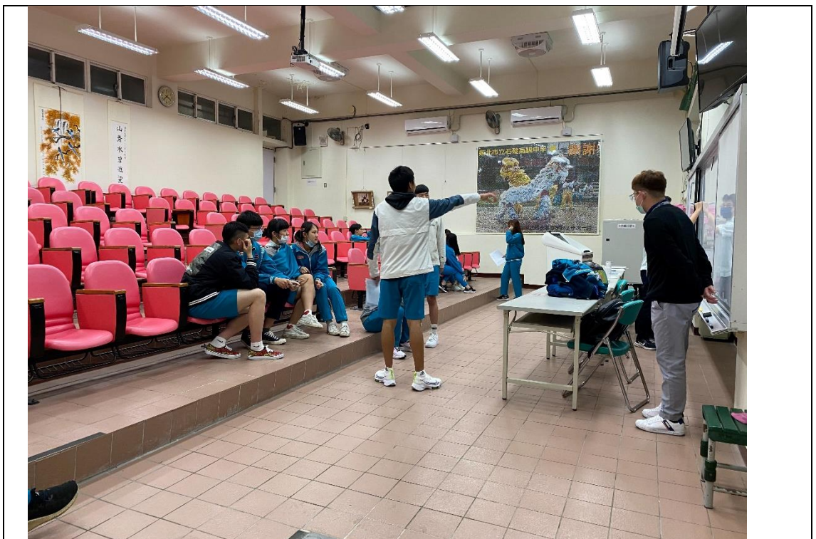
學生集思廣益提出許多點子

透過事前的溝通討論，讓學生自治會先提出幾個校園改進的計劃，學務處再帶著學生將問題聚焦為三個，之後學生自治會再分成三組完善計畫並邀請相關處室討論(如體育組、營養師等)，在朝會時向學校說明並在網路公告計畫，最後再由班代表彙整班級意見票選出代表石碇高中的計畫送教育局申請經費。