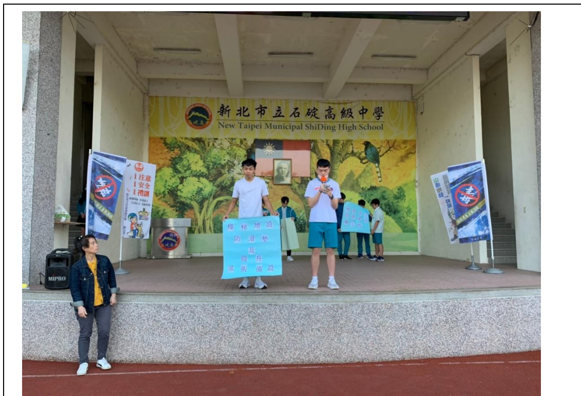
朝會時同學說明方案一