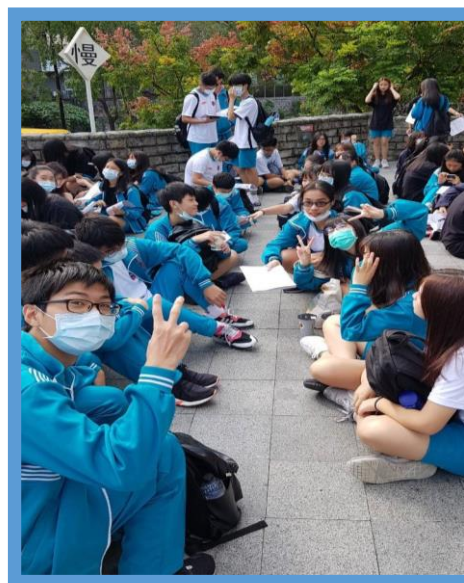
北投捷運站集合照